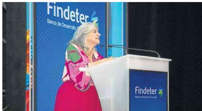
La ministra de Vivienda, Catalina Velasco, anunció que la entrega de subsidios para el 2024 está proyectada para ser entregada a más de 50.000 compradores.

Los subsidios se puede recibir a través de 'Mi Casa Ya', Cajas de Compensación, Concurrencia de Subsidios o viviendas VIS y VIP.