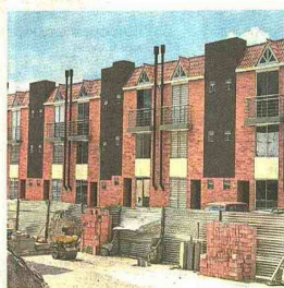
Espacios del conjunto residencial Reservas de Abora, Tocancipá.

Según varias fuentes consultadas, los beneficios del crecimiento de la provincia son los mayores recursos que están ingresando a las arcas municipales, a raíz del aumento del recaudo de impuestos, lo que les permite a las alcaldías