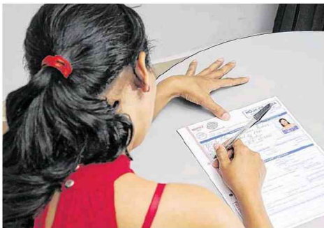
Si bien el desempleo femenino viene mostrando mejores signos, la tasa sigue siendo mucho más alta frente a la de los hombres, dicen analistas.

Por su parte, la tasa de ocupación en la ciudad aumentó en los últimos doce meses. Subió de 51,4% en el